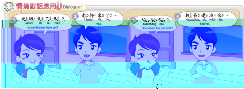
图四 〈常用中文句型〉“”图示

在各单元设计中,也设计了该句型所需的组件,亦即词群的延伸设计,旨在提供同一语法模板的适用元素,将此一模板的实用性延伸拓展,企图让学习者的词汇库得以扩充,进一步开展表情达意的范畴,落实于相互作用的认知活动中,如图(五)所示: