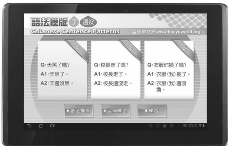
图十 其他行动装置 Tablet 学习图