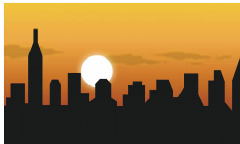
图二 “天还没黑”的意象图示