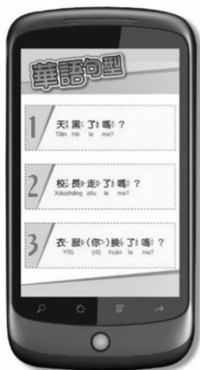
图八 华语句型 单 图示

“ 华 语 句 型 ” 选 , 句 句 , 如 ( ) 所 。 点 选 句 型 1 “ 了 吗 ? ” 后 , 句 1 “ 了 。” 的 , 如 下 ( ) 。