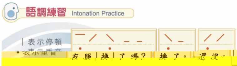
图七 常用中文句型语调练习图示

句 是 中 语 → → 句 的 现, 在 语 句 的 语 重 , 也 的 现, 的 主 重 、 重 , 学 习 分 语 , 学 习 句 型 的 利 , 如 ( ) 所 :