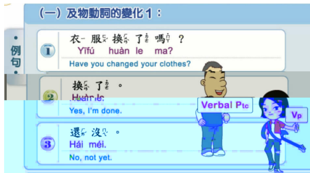
图三 〈常用中文句型〉“学习目标”图示

面，分，循序渐， 间起浅深联。起眼，就活需求基 ，间了间差异。 自独，也自，每三，这些 ，等基和，此举《》〈〉 614 ” ” 例：