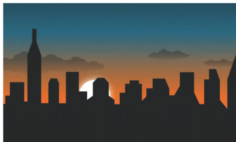
图一 “天黑了”的意象图示